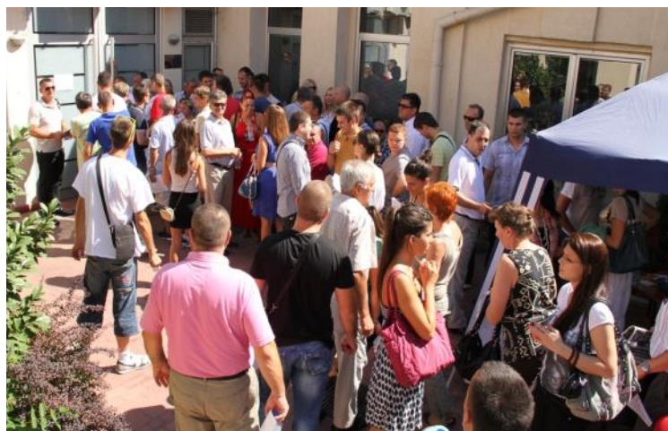
Рекордна акција добровољног давања крви у ГО СНС Београд