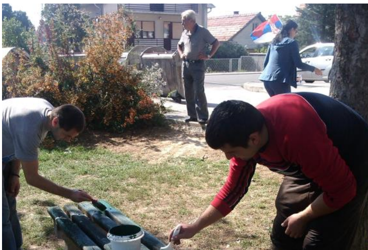
Уређивање паркића у Рушњу