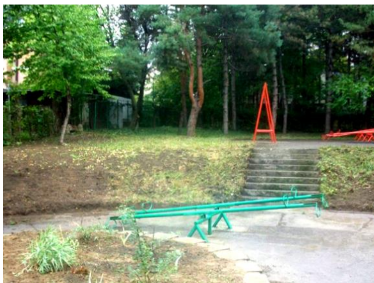
Паркић у Белим водама пре и после акције сређивања