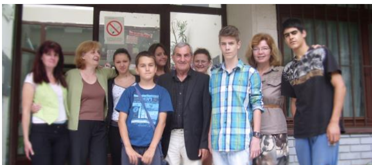
Бесплатна припрема основаца за пријемни испит

“Савет за просвету и верска питања ОО СНС Чукарица покретач је акције бесплатних часова за основце, средњошколце и студенте на територији Општине Чукарица. Наставу је до сада похађало више од 50 ученика, којима смо држали часове математике, српског језика, физике, механике... Ови часови се одржавају у континуитету током школске године: у просторијама ОО СНС Чукарица, МЗ “Нови Железник”, МЗ “Горица” и МЗ “Железник”, а по потреби и у становима наших ученика. До сада је одржано више стотина часова бесплатне наставе, а најзаслужнији за континуитет ове акције свакако су В. Лаврич, Д. Стојановић, К. Стевановић – аутор