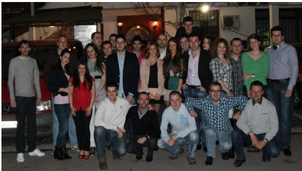
Хуманитарно вече „Млади за младе“ на Чукарици