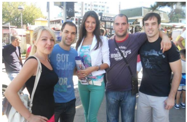
Сваког дана са нашим комшијама :)