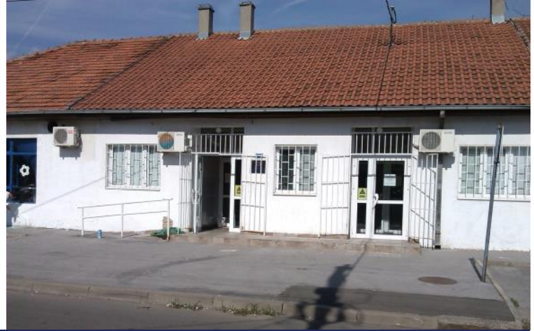
Центар Рушња пре и после акције наших омладинаца